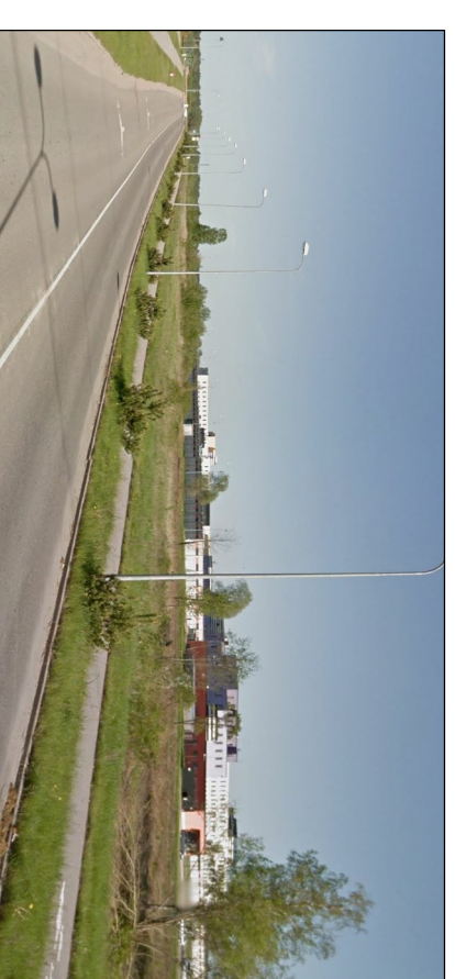
Vaade planeeringualale Kaupmehe ja Turu tänava ristnõukult